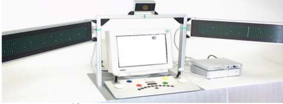
الشكل (2) يوضح الإعداد والوضع الصحيح لمنظومة فينا

عند تهيئة المفحوص للاختبار، ينبغي أن يكون مستوى جلوسه بحيث تكون عيناه بمستوى واحد مع العلامات الخضرة الموجودة إلى يمين ويسار إطار وحدة الجهاز. لذا فإن وجود منضدة أو كرسي قابل لتعديل الارتفاع يعدّ ضرورة في هذه الحال. وبالطريقة نفسها ينبغي أن يكون جلوس المفحوص بحيث يكون رأسه (الموقع الأفقي لمنتصف العينين) مواجه لمنتصف الإطار (المؤشر باللون الأزرق الموجود على الإطار) أي بمعنى أن يكون رأسه بالضبط في منتصف الجهاز، كما ينبغي أيضاً التأكد عند تركيب وتهيئة الجهاز من أن الصفیحة المعدنية (القاعدة المربعة التي تحمل الجهاز والموضوعة على المنضدة) أن تكون ضمن مستوى حافة المنضدة، ومن أن شاشة الحاسوب تكون متوسطة ومتمركزة ضمن الإطار المعدني المربع للجهاز. وكما هو موضح في الشكل (2)