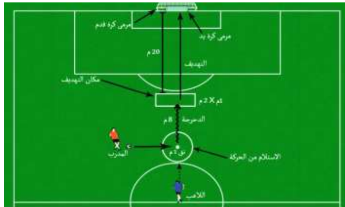
الشكل (6) يوضح اختبار الاستلام ثم الركض ثم التهديف