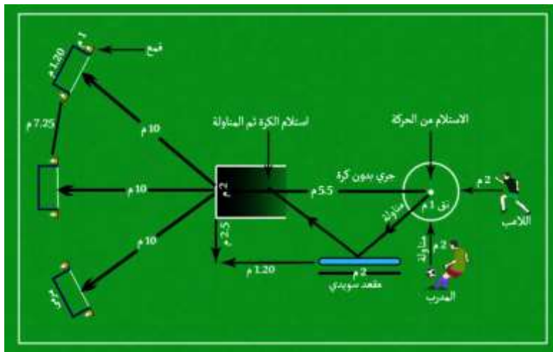
شكل ( 1 ) يوضح اختبار الاستلام ثم التمرير