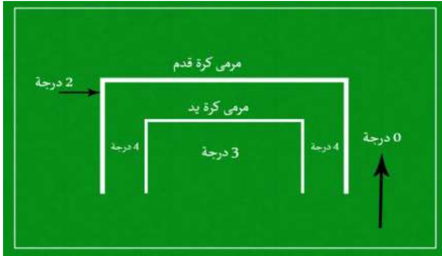
الشكل (5) يوضح درجات الدقة لاختبار الاستلام ثم التهديف

الاختبار الرابع: اختبار مهارة الاستلام ثم الركض ثم التهديف: