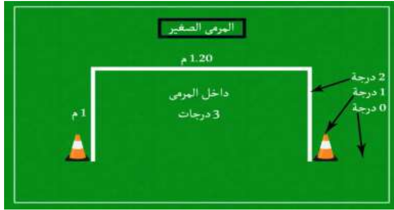
شكل ( 2 ) يوضح درجات الدقة لاختبار الاستلام ثم التمرير

الاختبار الثاني: اختبار الاستلام ثم الركض ثم التمرير: