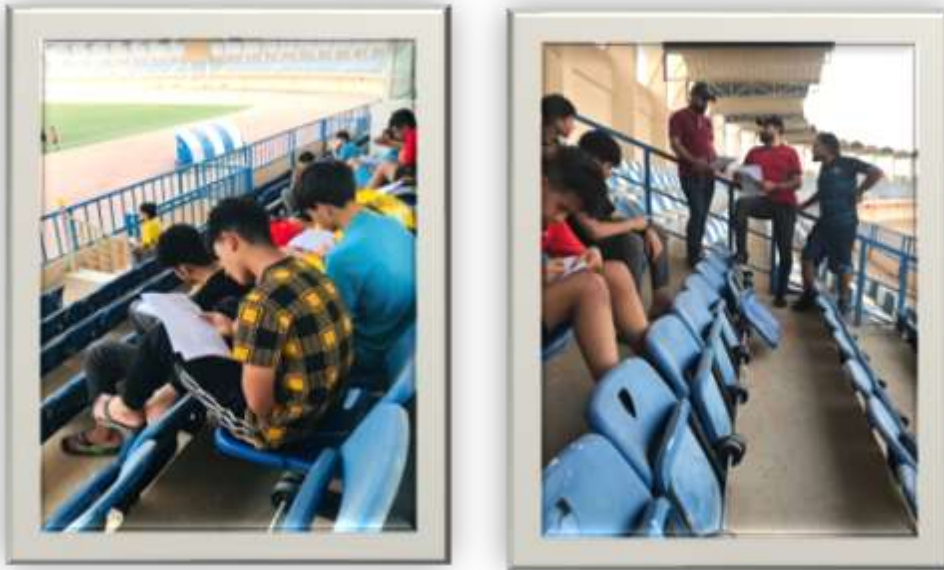
شكل رقم (2) لعينة اعداد المقياس

تم تطبيق الذات المهارية المكونة من (31) فقرة على أفراد عينة أعداد البحث البالغ عددهم (91) والذين يمثلون لاعبين أكاديميات الفرات الأوسط خلال المدة المحصورة ما بين 2022/5/27 ولغاية 2022/7/1 وفق شروط و تعليمات المقياس وبعد الانتهاء من تطبيق المقياس قام الباحث بجمع البيانات الخاصة بأفراد العينة وترتيبها تمهيدا لاستخراج موضوعية استجابة المختبرين وإجراء المعالجات الإحصائية لها والشكل رقم (2) يوضح ذلك.