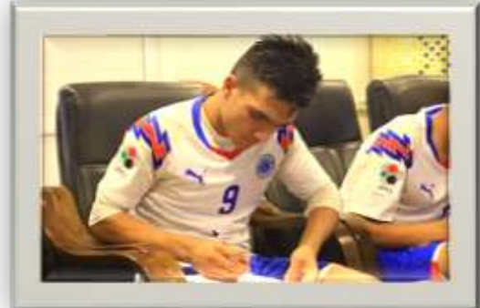
شكل رقم (1) يوضح التجربة الاستطلاعية لمقياس الذات المهارية