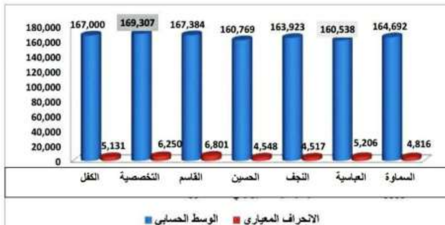
شكل (4) الاوساط الحسابية والانحرافات المعيارية لعينة البحث

الجدول (8) و الشكل (4) يبينان ان فريق المدرسة التخصصية حصل على اعلى درجة في مقياس السمات الانفعالية بوسط حسابي (169,307) وانحراف معياري (6,250) ويليه فريق القاسم بوسط حسابي (167,384) وانحراف معياري (6,801) ثم فريق الكفل بوسط حسابي (167,000) وانحراف معياري (5,131) و جاء فريق السماوة بالمرتبة الرابعة بوسط حسابي (164,692) و انحراف معياري (4,816) ثم فريق النجف بوسط حسابي (163,923) و انحراف معياري (4,517) ويليه فريق الحسين بوسط حسابي (160,769) وانحراف معياري (4,548) و حصل فريق العباسية على اقل درجة على مقياس السمات الانفعالية بوسط حسابي (160,538) و انحراف معياري (5,206) كذلك بلغ الوسط الحسابي للفرق السبعة (164,797) بانحراف معياري قدره (3,344).